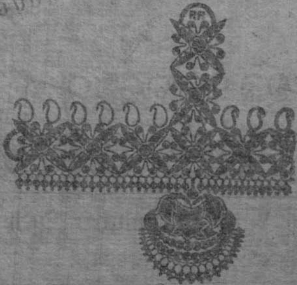
ଘାଟିର ଦୋସାଣର ଉପାୟ